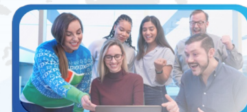
Magang & Studi Independen Bersertifikat